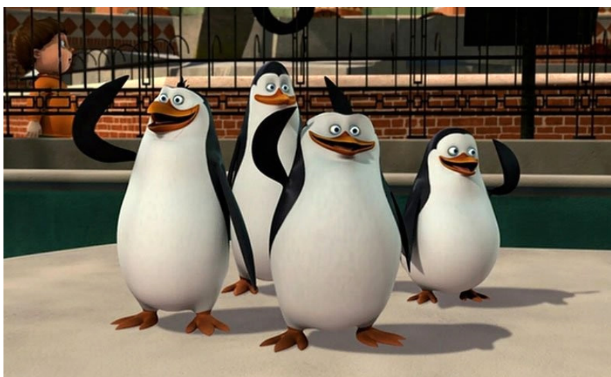
Figure 1: https://www.meme-arsenal.com/en/create/template/805594

Úloha 26 (♥). Ukažte, že prostor \mathbb{R}^2 \setminus \mathbb{Q}^2 je křivkově souvislý.