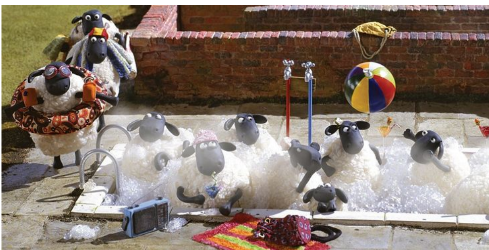
Figure 1: https://www.cbr.com/shaun-the-sheep-best-worst-episodes-imdb/